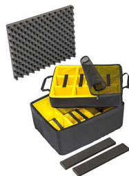
1607AirDS Комплект мягких модульных перегородок