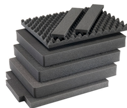
1607AirFS Комплект запасных прокладок из вспененного материала (3 шт.)