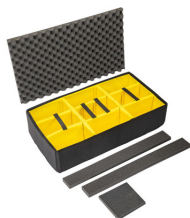
1615AirDS Комплект мягких модульных перегородок