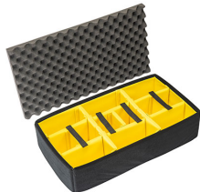
1605AirDS Комплект мягких модульных перегородок