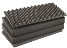
1605AirFS Комплект запасных прокладок из вспененного материала (4 шт.)