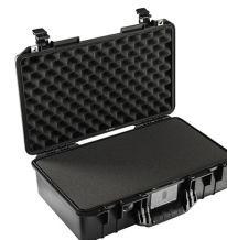
1525WF With Foam