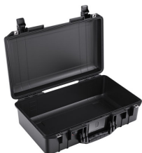
1525NF No Foam