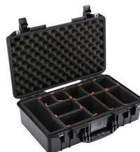
1525TP With TrekPak Divider System