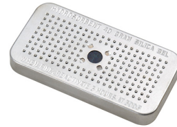
1500D Desiccant Silica Gel