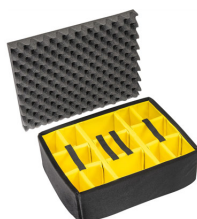
1565 Set di divisori imbottiti