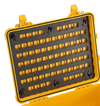
1560MP EZ Click MOLLE Panel