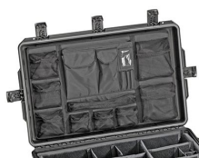
IM2875-UTILITYORG Organizer accessori