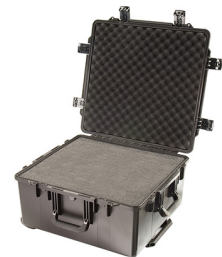
iM2875-X0001 With Foam