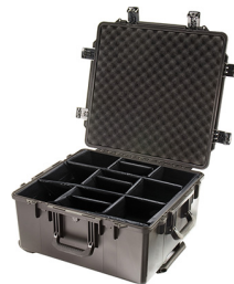
iM2875-X0002 With Padded Dividers