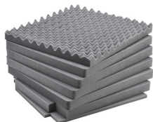
IM2875-FOAM 7 pz. set ricambio schiuma