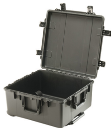
iM2875-X0000 No Foam