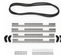
IM2875-M4-BEZEL-L Lid Bezel (Metric)