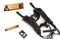
RucPac-normal Conversione zaino RucPac standard Hardcase