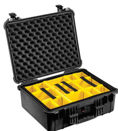
1554 With Padded Dividers