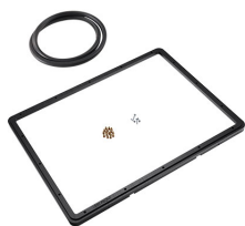
1550PF Telaio del pannello per applicazioni speciali