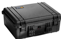
1550NF No Foam