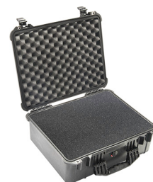
1550WF With Foam