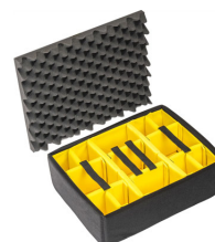
1555 Set di divisori imbottiti