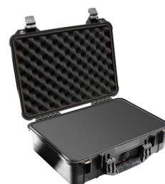
1500WF With Foam