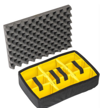
1505 Set di divisori imbottiti