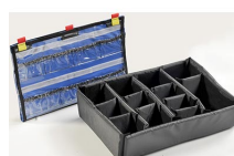
1505EMS EMS Accessory Set (Lid Organizer and Divider Set)