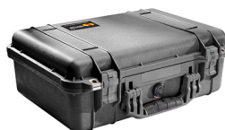
1500NF No Foam