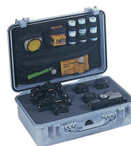
1508 Coperchio organizer per fotografi