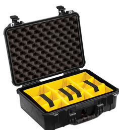
1504 With Padded Dividers