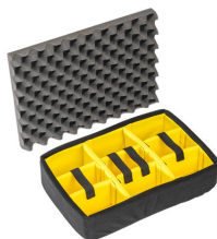
1505 Set di divisori imbottiti