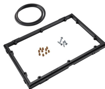
1150PF Telaio del pannello per applicazioni speciali