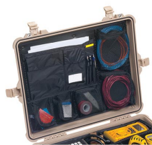
1609 Copertina organizer