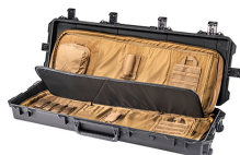
472-PWC-DW3200-BLK-COY Black Case With Coyote Soft Case