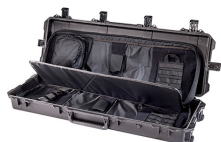
472-PWC-DW3200-BLK-BLK Black Case With Black Soft Case