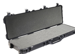
1750WF With Foam