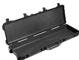
1750NF No Foam