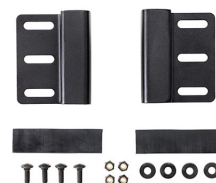
LGMT-001P Supporto per portapacchi per valigie Peli Protector