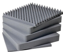
1641 5 pz. set ricambio schiuma