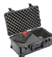
1510TPF TrekPak / Foam Hybrid