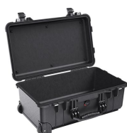
1510NF No Foam