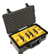
1514 With Padded Dividers