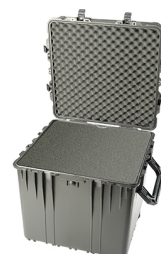
0370WF With Foam