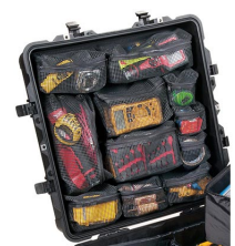
0379 Coperchio organizer