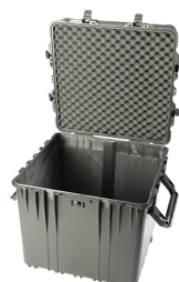
0370NF No Foam