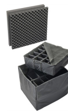
0375 Set di divisori imbottiti