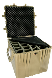
0374 With Padded Dividers