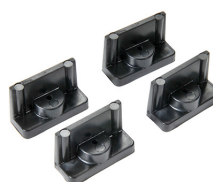
1507QM Supporti veloci - set di 4