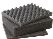
1201 3 pz. set ricambio schiuma