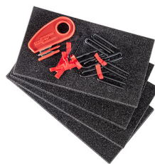
1506TPKIT Kit divisorio per valigie TrekPak