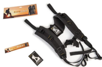
RucPac-normal Conversione zaino RucPac standard Hardcase