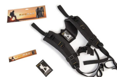
RucPac-normal Conversione zaino RucPac standard Hardcase