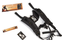
RucPac-normal Conversione zaino RucPac standard Hardcase