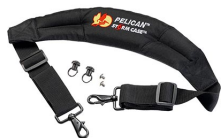
iM-STRAP-S-VER2 Padded Shoulder Strap