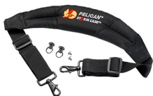
iM-STRAP-S-VER2 Padded Shoulder Strap