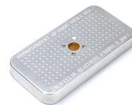
1500D Gel di silice essiccante