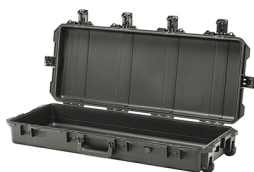
iM3100-X0000 No Foam