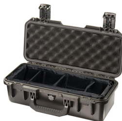
iM2306-X0002 With Padded Dividers