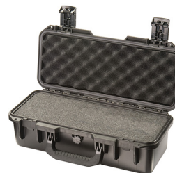
iM2306-X0001 With Foam