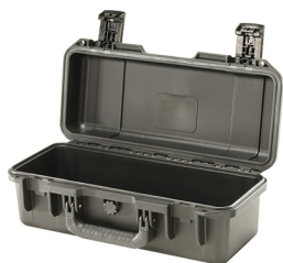
iM2306-X0000 No Foam