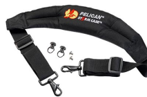
iM-STRAP-S-VER2 Padded Shoulder Strap