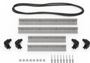
iM2200-MBEZ-B Lunetta della base (metrica)