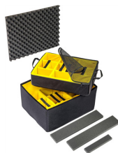
1637AirDS Set di divisori imbottiti