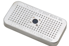
1500D Gel de silice déshydratant Peli