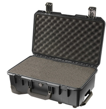
iM2500-X0001 With Foam