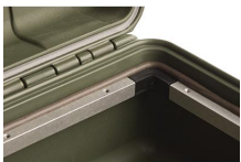
iM2500-MBEZ-B Cadre de base (métrique)