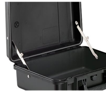
iM-LIDSTAY Compas de couvercle