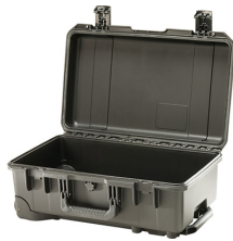
iM2500-X0000 No Foam