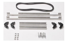
iM2500-M4-BEZEL-L Cadre de couvercle (métrique)