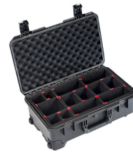
iM2500-X0006 With TrekPak Divider System