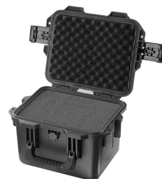
iM2075-X0001 With Foam