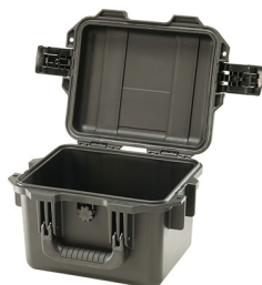
iM2075-X0000 No Foam