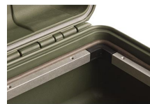
iM20XX-M4-BEZEL Cadre de base (métrique)