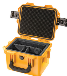
iM2075-X0002 With Padded Dividers