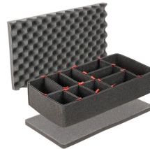
1525TPKIT Kit de séparation de la valise TrekPak