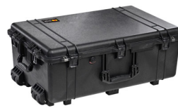
1650NF No Foam