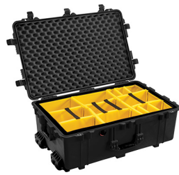
1654 With Padded Dividers