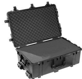
1650WF With Foam