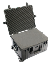
1620WF With Foam