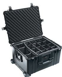
1624 With Padded Dividers