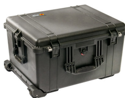
1620NF No Foam