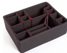
1610EUTP Kit de séparation de la valise TrekPak