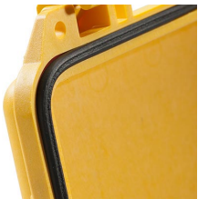
0343 Joint torique de remplacement