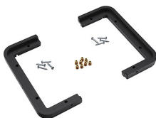
1430PF Cadre de panneau pour application spéciale