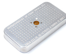
1500D Gel de silice dessicant