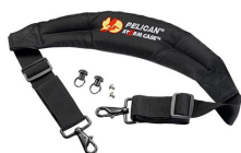
iM-STRAP-S-VER2 Bandoulière rembourrée