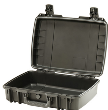
iM2370-X0000 No Foam