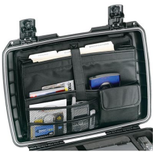
iM2370-UTILITYORG Pochette utilitaire