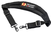
iM2370-STRAP-S Bandoulière rembourrée amovible