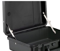
iM-LIDSTAY Compas de couvercle