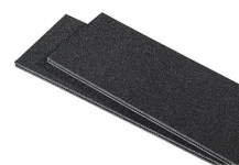
iM2200TPDIV Séparateurs TrekPak supplémentaires