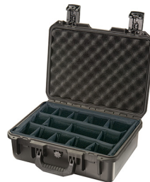
iM2200-X0002 With Padded Dividers