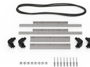
iM2200-M4-BEZEL-L Lunette du couvercle (métrique)