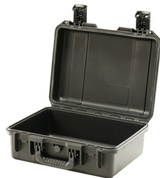
iM2200-X0000 No Foam