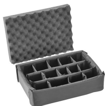
iM2200-DIV Cloison en mousse