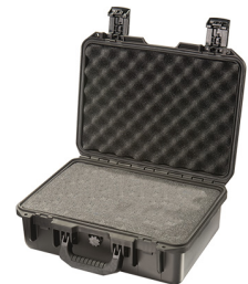
iM2200-X0001 With Foam