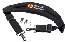
iM-STRAP-S-VER2 Bandoulière rembourrée