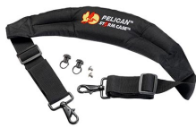
iM-STRAP-S-VER2 Bandoulière rembourrée