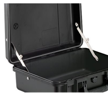
iM-LIDSTAY Compas de couvercle