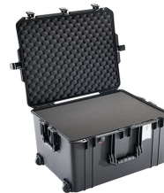
1637WF With Foam