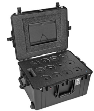
WINE-12B 12-Bottle Wine