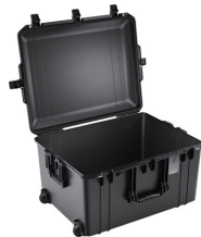
1637NF No Foam