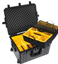
1637WD With Padded Dividers