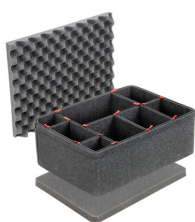
1557TPKIT Kit de séparation de la valise TrekPak