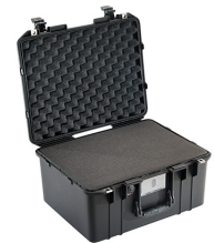
1557WF With Foam