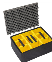
1557AirDS Cloison en mousse