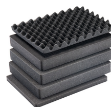
1557AirFS Jeu de mousses de rechange, 3 pièces