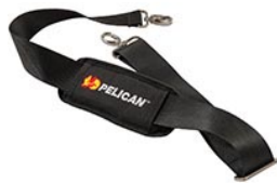
9487 Correa para hombro acolchada