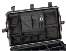
iM29XX-UTILITYORG Organizador de accesorios