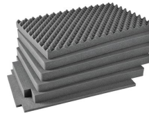
iM2950-FOAM Juego de 6 piezas de espuma de recambio