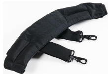
iM-STRAP-S-VER2 Correa para hombro acolchada