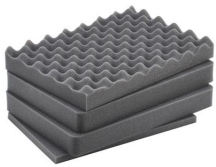
iM2200-FOAM Juego de 4 piezas de espuma de recambio