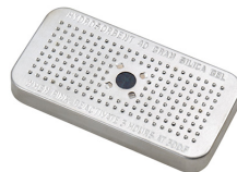
1500D El gel de sílice desecante Peli