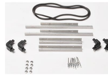
iM2200-M4-BEZEL-L Instalaciones electrónicas con tapa (métricas)