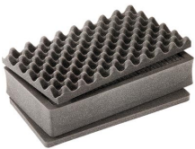
1485AirFS Juego de 3 piezas de espuma de recambio