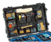
1659 Organizador de material fotográfico/tapa