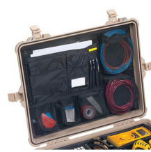
1609 Organizador de tapa