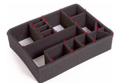
1600EUTP Kit de divisores TrekPak