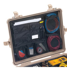
1609 Organizador de tapa