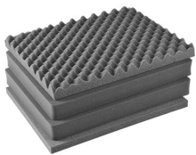
1601 Juego de 4 piezas de espuma de recambio