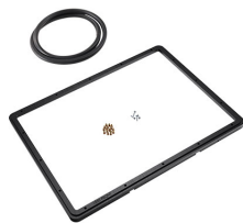
1550PF Panel de adaptación para aplicación especial