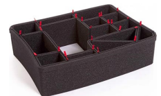
1550EUTP Kit de divisores TrekPak